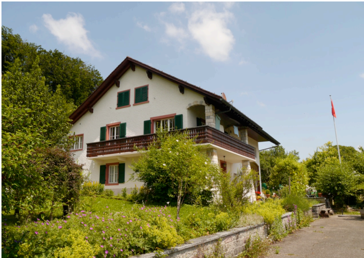
Das Ita Wegman Mutter-Kind-Haus in Gempen/SO